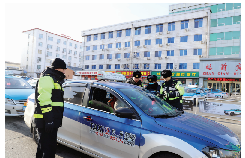
▲ 佳木斯市交通运输执法人员定点检查火车站出租车