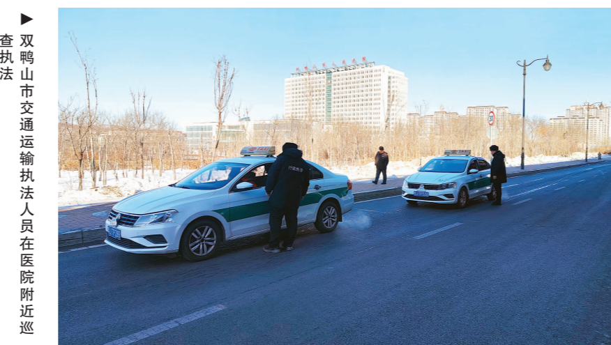
▲ 双鸭山市交通运输执法人员在医院附近巡查执法