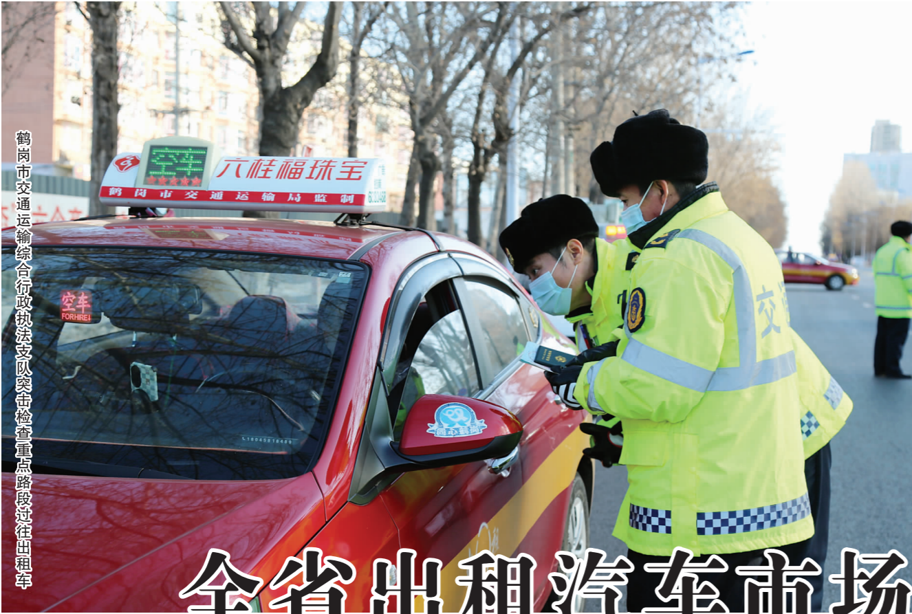
鹤岗市交通运输综合行政执法支队重点路段过往出租车