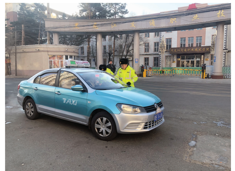
▲ 齐齐哈尔市交通运输执法人员在学校附近开展流动巡查