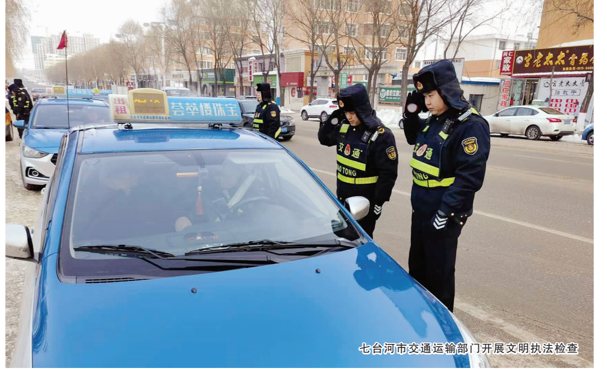
七台河市交通运输部门开展文明执法检查