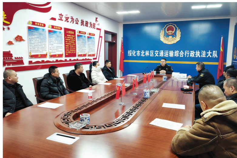
▲ 绥化市北林区交通运输部门约谈出租汽车经营