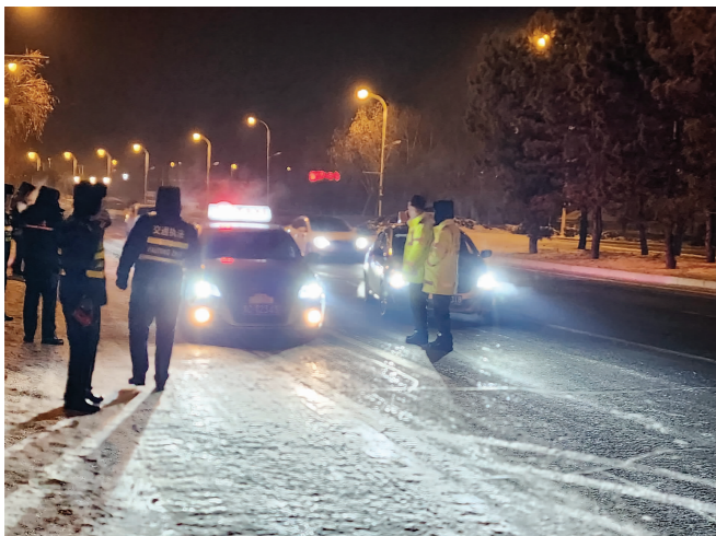
▲ 牡丹江市交通、交警执法人员不畏严寒联合夜查