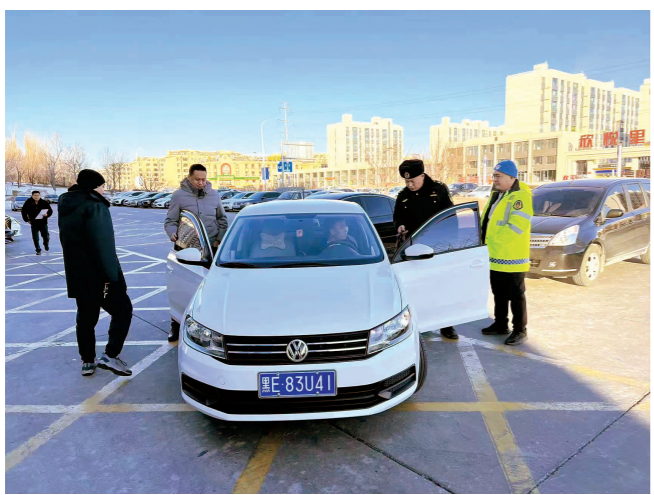
▲ 大庆市交通运输综合行政执法支队查扣群众举报车辆