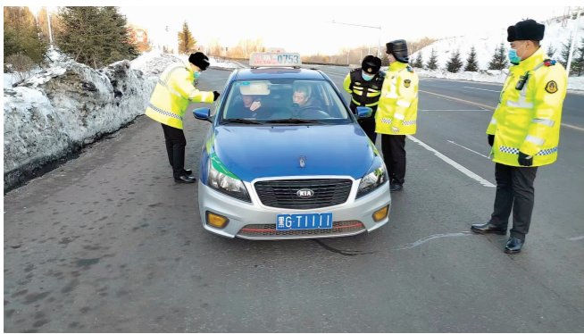
▲ 鸡西市交通运输执法人员在鸡西西站必经路段检查出租车

近日,省交通运输厅、省委宣传部等9家单位联合,在全省范围内开展出租汽车市场专项整治行动。本次行动计划用约100天的时间,从严、从速、从重查处出租汽车行业各类违法违规行为,全面规范出租汽车市场秩序,增强交通旅游效能,助力冬季冰雪旅游,保障人民群众安全、满意出行,服务全省经济社会发展。专项行动开展以来,全省共出动执法人员6481人次,执法车辆978台次,检查车辆10556台,查处违法违规车辆216台次,处罚平台企业1家,处理扰序案件35件,拘留喊客揽客人员5人,训诫、警告喊客揽客人员75人。