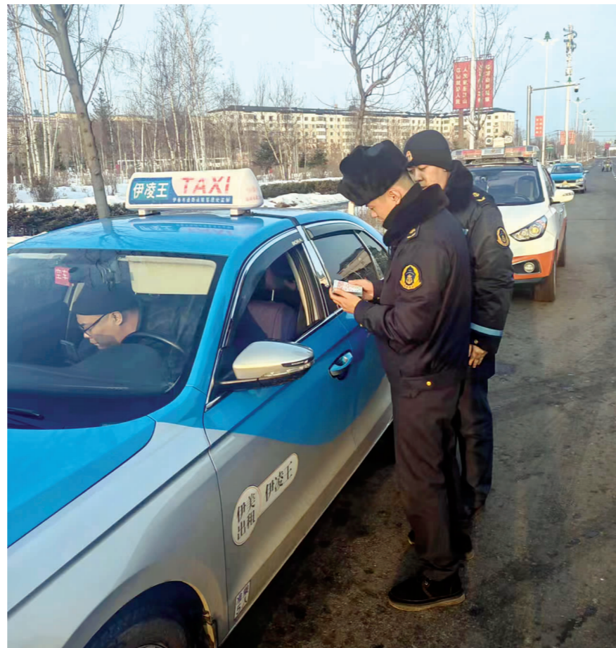
▲ 伊春市交通运输执法人员在城乡结合部开展执法检查