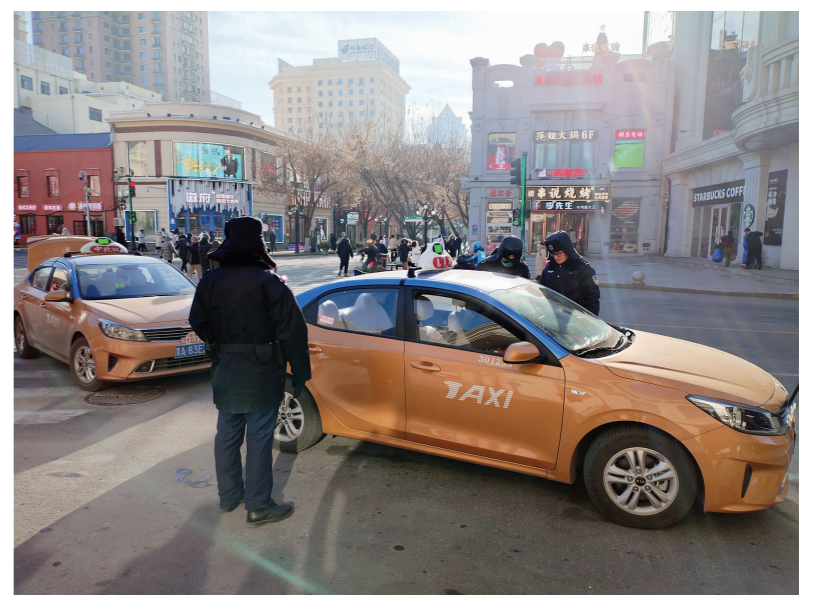
▲ 哈尔滨市交通运输局在中央大街设点检查