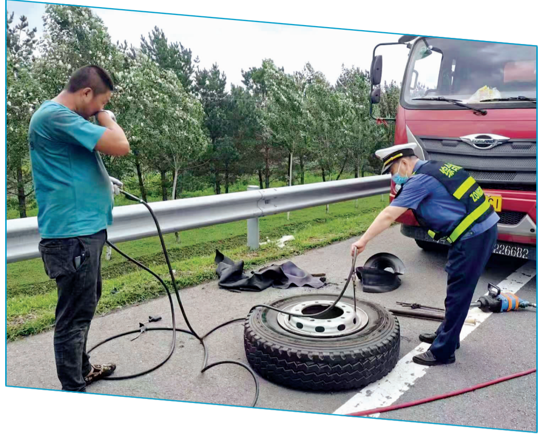
▶ 执法人员帮助事故车辆更换轮胎