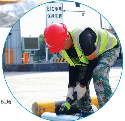
▶ 收费站品质提升改造现场