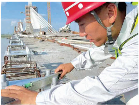
▼ 鹤大高速佳木斯过境段松花江特大桥施工现场