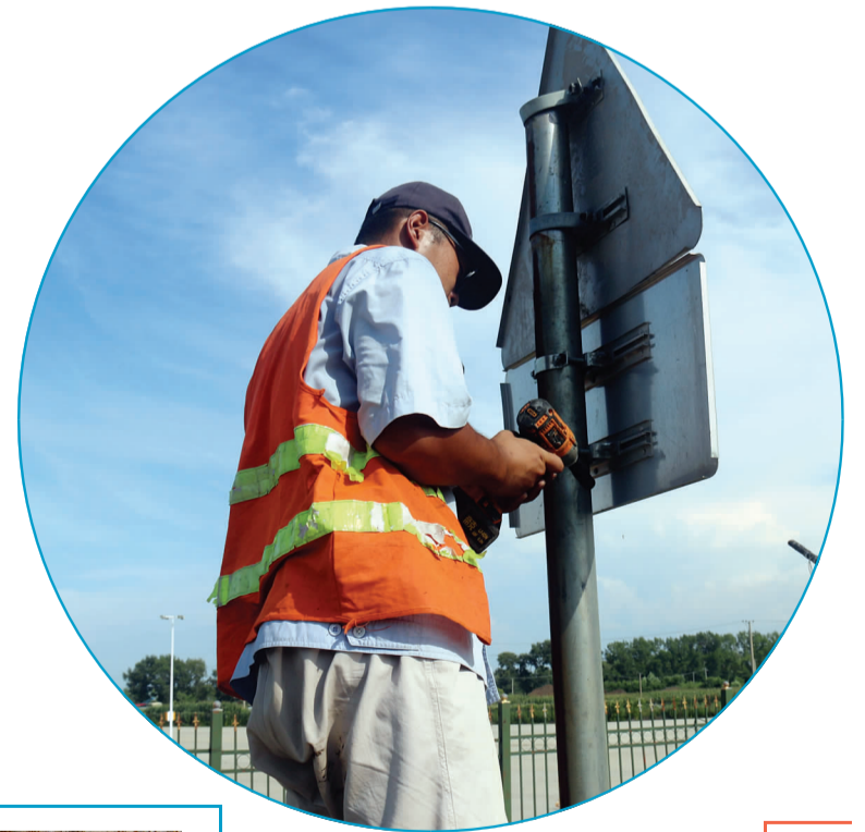
▶ 高温下,养路工人更换破损标志牌