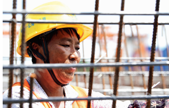
▶ 吉黑高速施工人员在烈日下作业