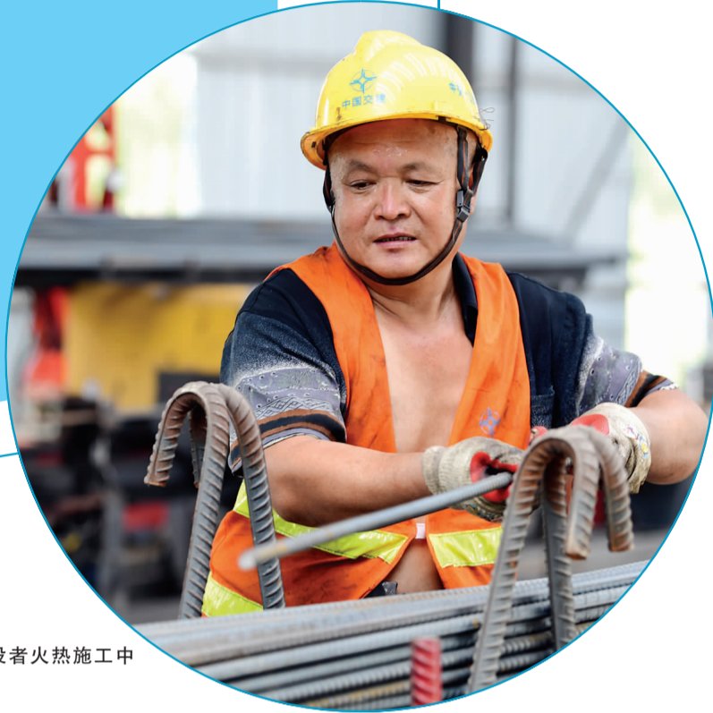
▶ 吉黑高速建设者火热施工中