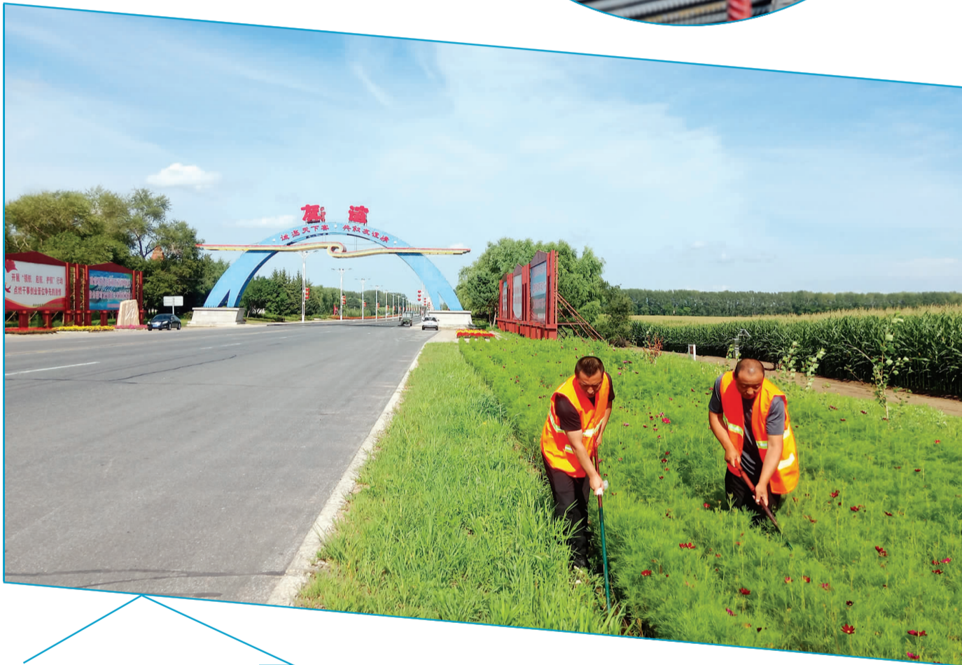
▶ 烈日下,公路养护工人除草忙