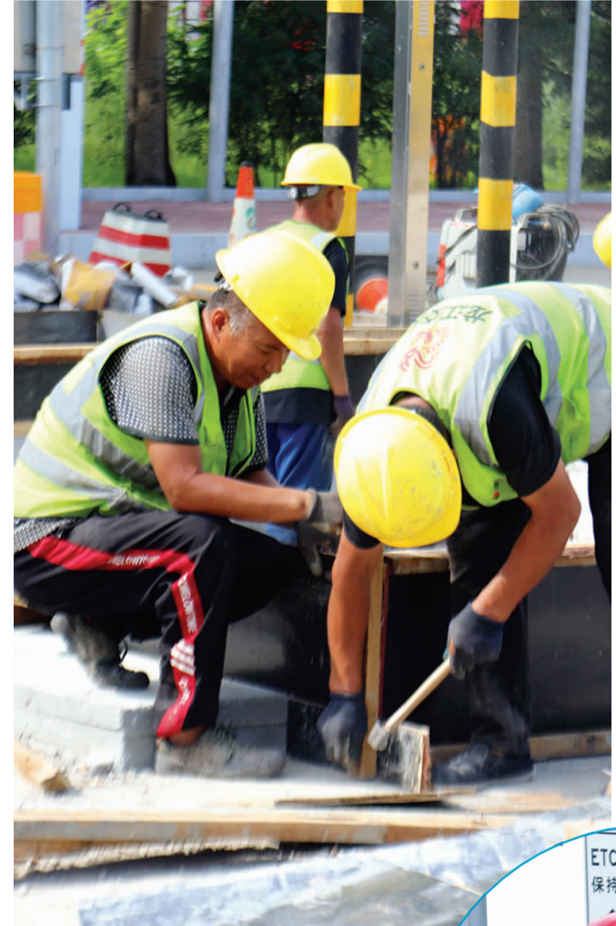
◀ 收费站品质提升改造现场,工人紧张作业