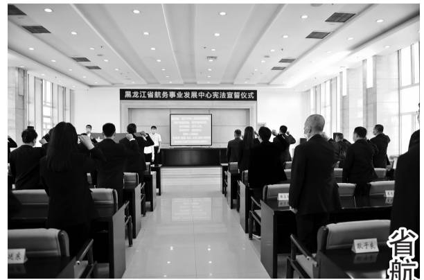
省航务事业发展中心

通过此次联建活动,促进了支部堡垒作用、能力提升和合力凝聚,实现了党建提振精神、党建引领工作、党建助力发展的目的。党员干部纷纷表示,要以坚定的理想信念、崭新的精神风貌、饱满的工作热情、坚强的党员意志,投入到践行党的宗旨伟大实践中去,以饱满热情和昂扬状态迎接党的二十大胜利召开。