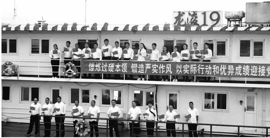
在党的二十大即将召开之际,为进一步推进“能力作风建设年”活动走深走实,贯彻落实省十三次党代会精神,促进党建工作和业务工作深度融合,9月16日,省交通运输厅港口航道处党支部与省航务事业发展中心机关航道事务处支部、齐齐哈尔航务事

中心龙凌19船队党支部以“支部联建提能力 携手同迎二十大”为主题,在龙凌19船队施工现场松花江中游167公里,共同开展支部联建活动。厅港口航道处、省航务事业发展中心、省航道事务中心、齐齐哈尔航务事务中心相关负责同志及支部共30余名党员和青年骨干参加联建活动。