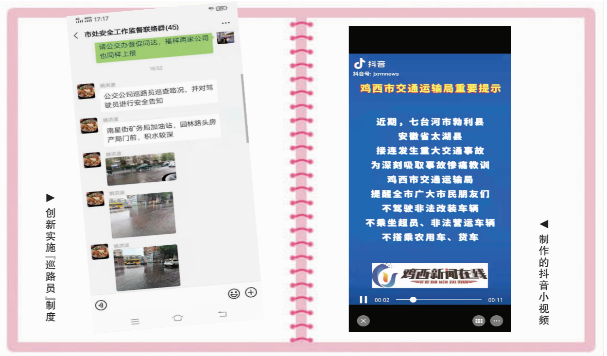
▶ 创新实施“巡路员”制度