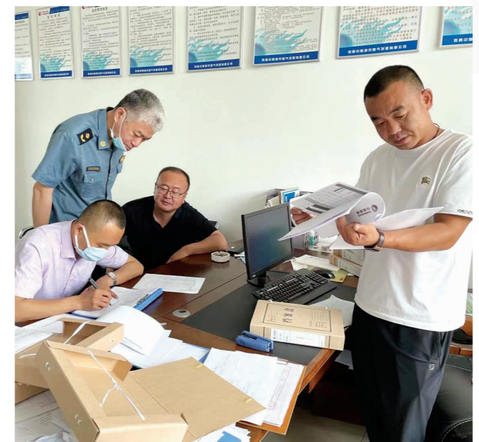
▲ 创新实施的安全服务进驻制度