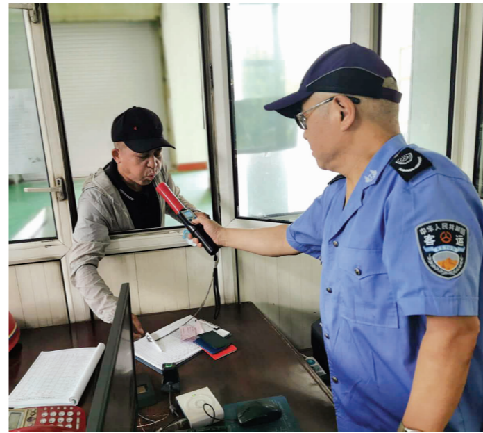
▲ 创新实施“望闻问测”制度

下一步,为适应日益繁重的安全监管任务,鸡西市交通运输局将把握安全监管“多元化”发展方向,继续推动“四创新、一服务”向深处落实,积极推动安全监管从以“人防”为主向“人防”和“技防”并重转变,有效防范安全生产事故的发生。