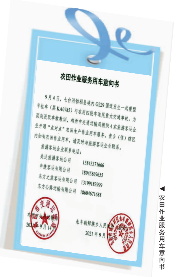
▲ 农田作业服务用车意向书