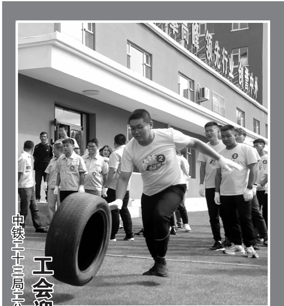
中铁二十三局二公司