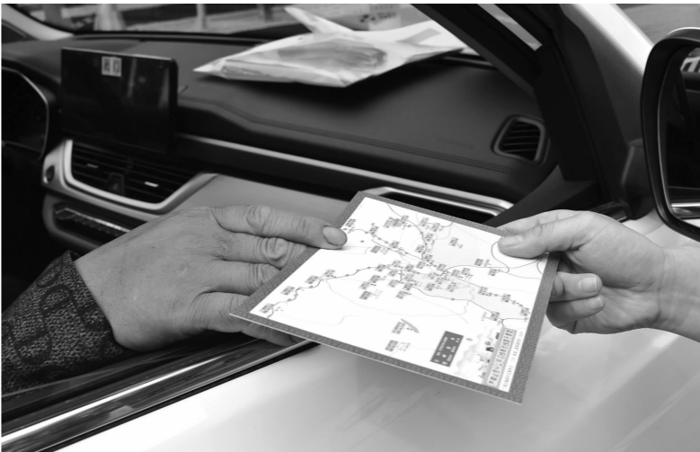
▲ 过往司乘发放沿线景点示意图