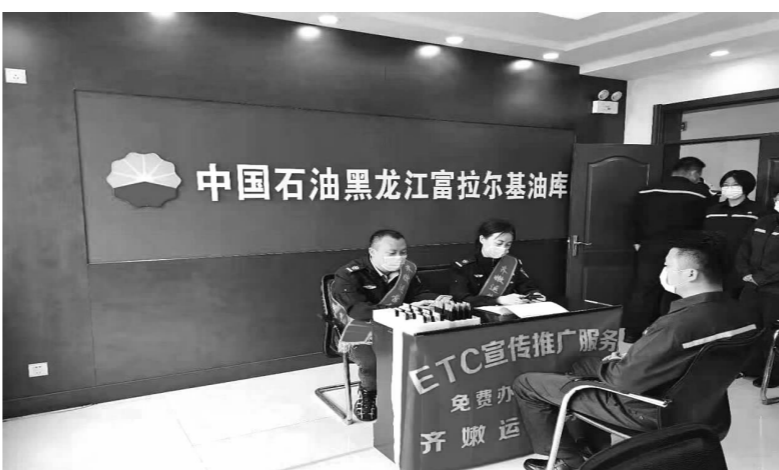
▲ ETC走进企业推广办理