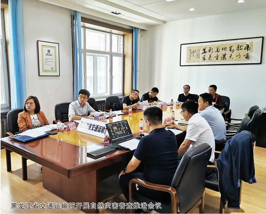
黑龙江省交通运输厅开展自然灾害普查筹备会议