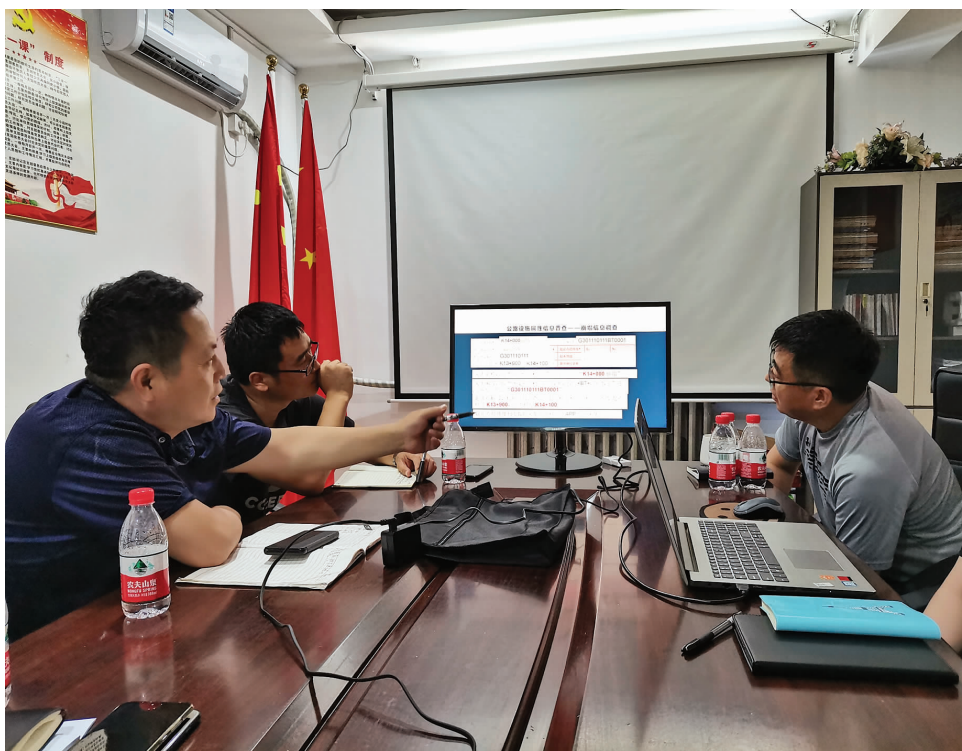
技术支撑组成员与普查办专家集中研讨修订培训 ppt 内容