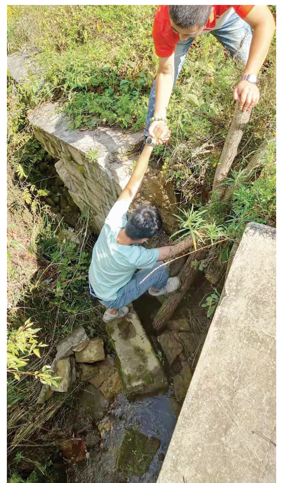
基层数据采集人员进行风险点信息采集