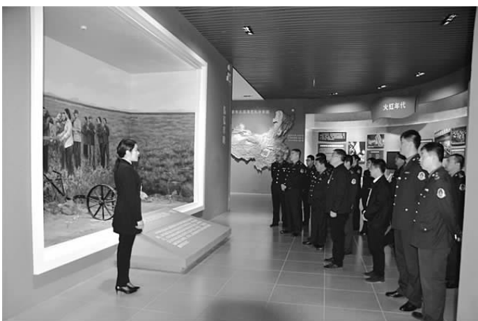
走进红色共青城接受党史学习教育