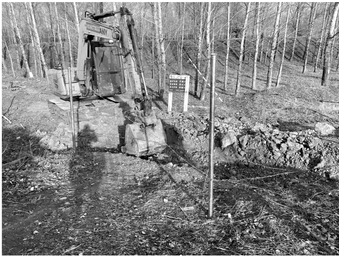
为了保障高速公路的路产路权,和广大车辆安全畅通的行车环境,高速运营齐齐哈尔养护公司甘南养护工区根据不同的路段地形特征,采取多项措施,对私开道口逃费行为进行有效治理。一是根据逃费道口实际情况,选择电焊加固、护栏外堆砌半米以上煤渣并浇水加固。二是降低巡查车速,提高巡查质量,在傍晚时段属于逃费易发时间,故增加一次傍晚巡查。三是派出专人对沿线村民进行法制宣传,讲清厉害关系,巩固好治理成果。图为封堵施工现场。