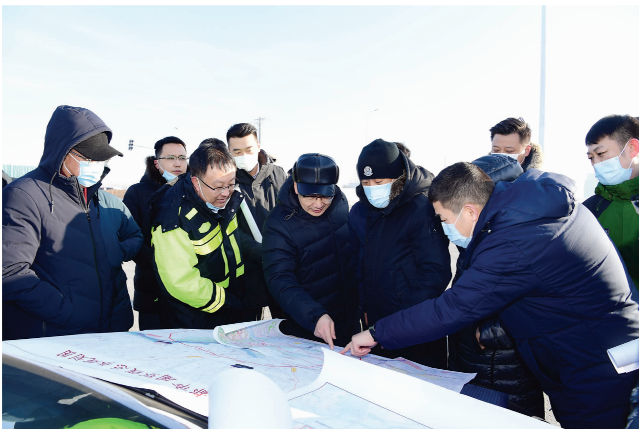
12月12日上午,副省长徐建国在厅长孙宇等的陪同下,来到哈尔滨市都市环线高速及世茂大道连接规划现场,听取了厅综合规划处关于哈尔滨市都市环线高速公路设计规划情况,并前往哈尔滨市恒大文旅城,听取了项目进展情况汇报。哈尔滨市松北区、绥化市及肇东市相关人员陪同调研。