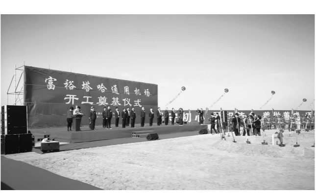
本报讯(刘中非 记者 姜久明)作为省政府确定的全省首批十六个通用机场之一,全省“百大项目”之一的富裕塔哈通用机场于9月28日正式开工建设。该机场作为短途运输的示范工

程,将主要用于改善市民出行环境,增强该地区应急救援公共服务功能,全面带动该地区旅游和经济发展。 富裕塔哈通用机场位于齐齐哈尔市东北部富裕县塔哈镇塔哈村,距离齐齐哈尔直线距离30公里。机场设计为A1级通用航空机场,预计2020年10月1日前建成通航,重点服务对象为从事通用航空业务的飞机和其他航空器及人员,主要从事农林作业、飞机喷漆、空中警务、空中救援服务、飞行签派代理、转场经停、飞行航校、短途运输、通航旅游、通航物流等业务。 项目计划总投资21867万元。根据新建黑龙江省富裕塔哈通用机场的功能定位,近期规划总占地面积428535平方米。主要包括飞行区、航站区、保障区。富裕塔哈通用机场充分利用齐齐哈尔的区位优势,依托支线机场,以通用航空短途运输为特色,建设短途运输服务中心,连接黑龙江、吉林、内蒙旅游和货物运输资源,建设跨省域的“通航+运输”网络,带动区域旅游资源集群化发展。同时,将进一步发展应急救援,促进当地旅游业、物流业快速发展。