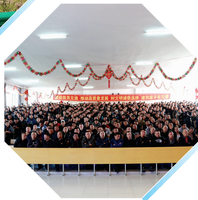
10月19日、20日两天时间,鹤岗市交通运输局组织专家学者对全市3000余名出租车驾驶员开展培训。