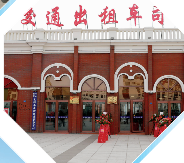
11月8日,“交通出租车司机之家”正式建成并投入使用。