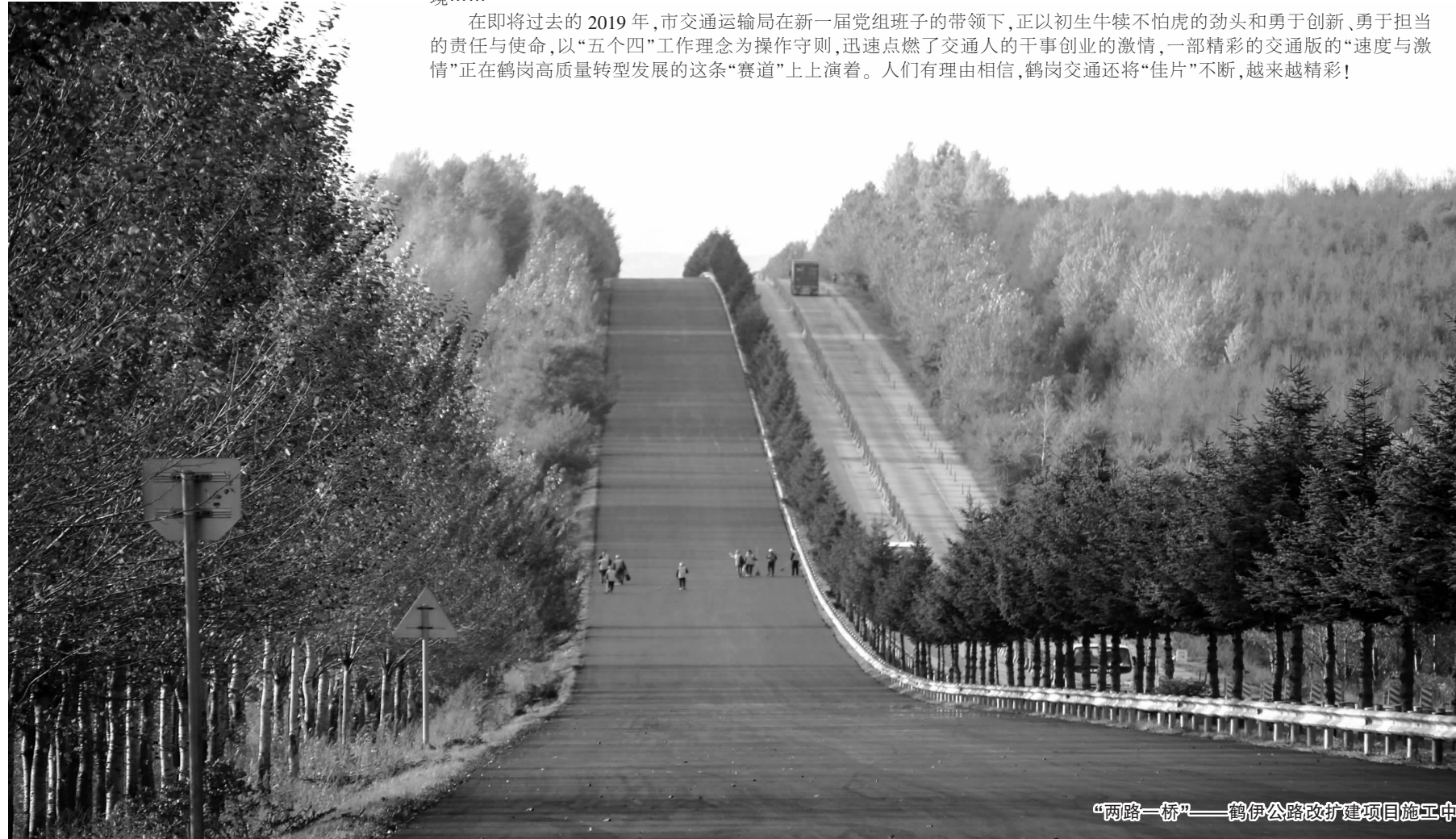
“两桥一桥”——鹤伊公路改扩建项目施工中

在即将过去的2019年,市交通运输局在新一届党组班子的带领下,正以初生牛犊不怕虎的劲头和勇于创新、勇于担当的责任与使命,以“五个四”工作理念为操作守则,迅速点燃了交通人的干事创业的激情,一部精彩的交通版的“速度与激情”正在鹤岗高质量转型发展的这条“赛道”上上演着。人们有理由相信,鹤岗交通还将“佳作”不断,越来越精彩!