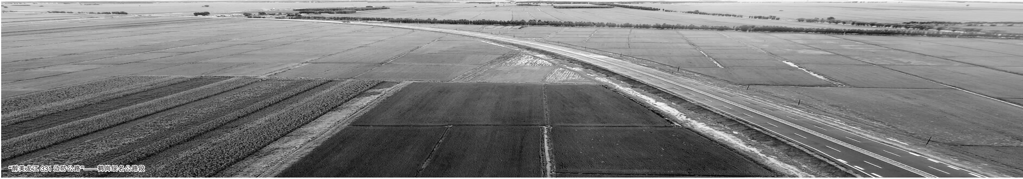
“最美龙江361边防公路”——鹤岗镇名公路

这是一场新思想的破冰之举,更是一场新思维的蜕变突围。2018年,对于鹤岗交通人来说,注定是一个头脑风暴之年。新一届市交通局领导班子以锐意进取、舍我其谁的责任担当,抓住问题症结,从全局干部职工思想层面破题,以新时期鹤岗交通精神为引领,迅速点燃了交通版的“速度与激情”,改变了交通历史现状,推动交通工作实现全面的高质量发展。