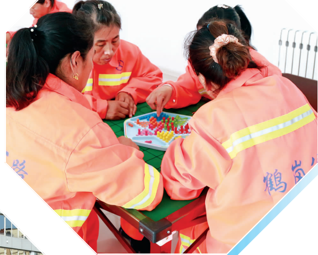
养路工人们在“交通养路工人之家”内休闲娱乐。