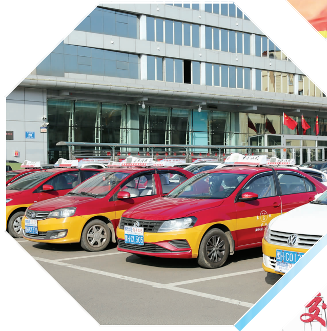
9月初,鹤岗市交通运输局在出租车行业实行了“十统一”。