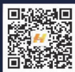
“黑龙江ETC”微信公众号 08:00--20:00人工在线客服