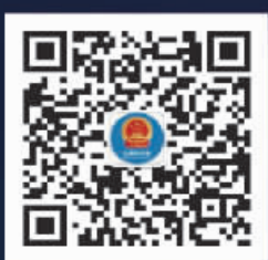
交通运输部ETC服务平台