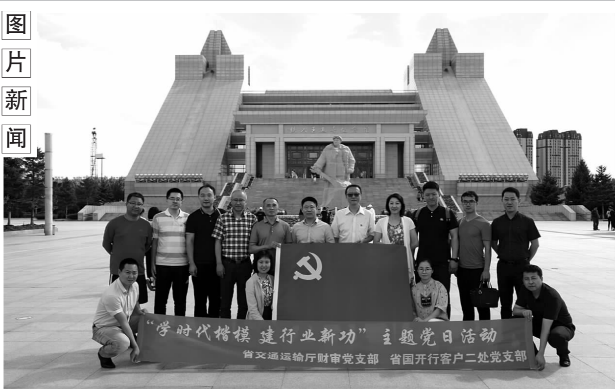
近日,厅财审党支部与国家开发银行黑龙江省分行客户二处党支部联合组织了“学时代楷模,建行业新功”主题党日活...

本报讯(雍大鹏)为认真贯彻落实上级交通部门关于组织开展行业消防安全专项检查活动的通知要求,做好本行业消防安全管理工作,近日,汤原农场交通科组织对“两站”开展了消防安全专项检查。检查中,交通科重点对客运站大厅、本籍和途经营运车辆以及公路站库房、养护车辆以及施工现场进行现场检查并查阅了消防安全工作台账,对消防安全制度、消防设施器材配备及保养情况、是否开展消防安全培训,营运车辆及公路养护车辆是否按规定配备消防器材并定期维护,是否进行消防演练等内容进行了全面的检查。并对相关从业人员进行了基本消防安全常识的培训,了解其是否会报警火警、是否掌握了灭火器材的使用方法。检查人员在检查中发现了消防安全隐患,问题及时指出并要求立即进行整改落实,增强了“一科两站”消防安全意识,提高了的消防安全管理水平,确保全场交通运输系统消防工作的万无一失。