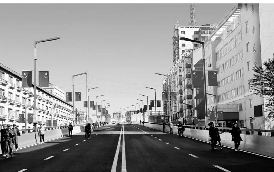
鹤岗市民共同见证复兴桥交工通车。

曾经的“复兴桥”是数字与平面图的结合,让鹤岗几代人翘首期盼了数十年。这里火车、汽车和行人混行,交通拥挤杂乱、高峰严重堵车等现象成了制约交通的顽疾。鹤岗市委、市