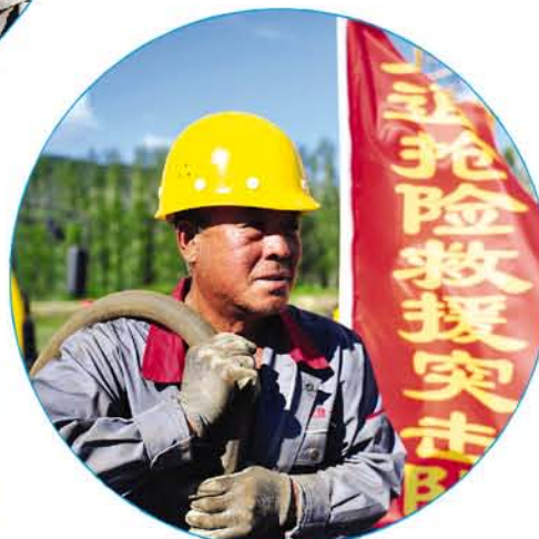
▲ 工人师傅正在作业