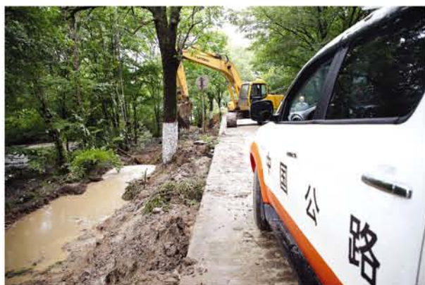
▲ 尚志公路站组织人员机械正在抢修