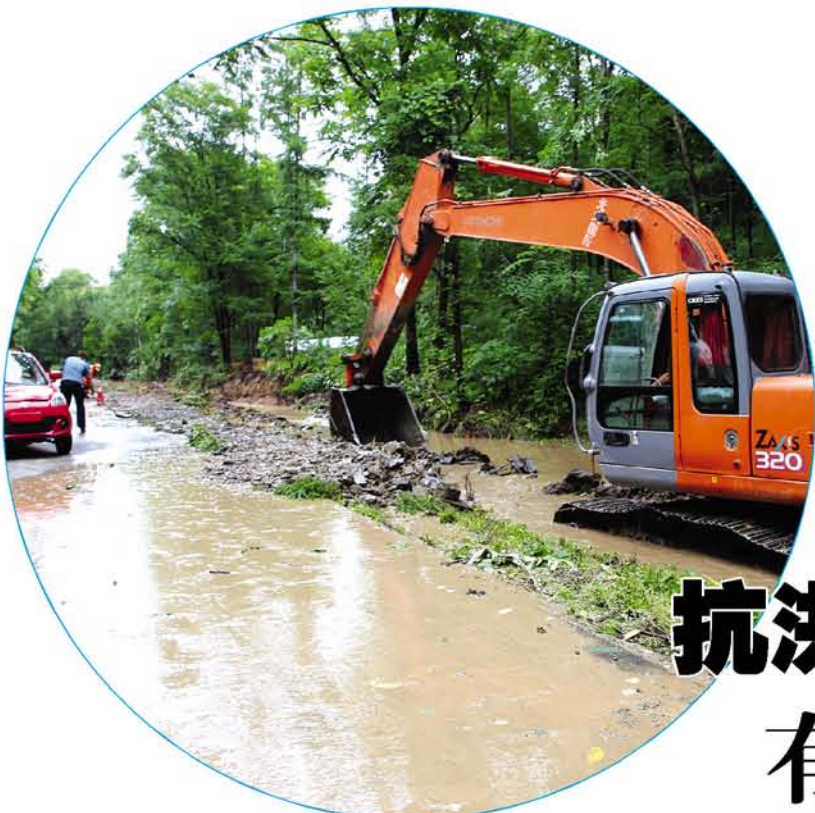
▲ 挖掘机正在整理被毁边沟