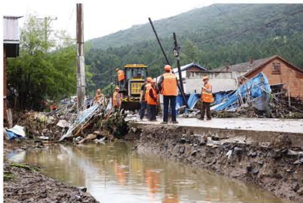
▲ 养路工人与机械正在作业