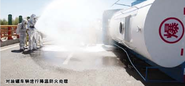
对油罐车进行降温防火处理

污染到桥面和江面的突发事故。 此次演练由省高速公路应急处置救援中心统一策划指挥,齐齐哈尔应急处置救援中心组织现场处置和紧急施救,齐齐哈尔海事局、省航道局、齐齐哈尔市医疗急救、消防特勤、交警支队、明月岛景区管理处、齐齐哈尔高速公路管理处等多家单位配合参演,共出动车辆、设备、船舶共计39台套,参演人员80余人。厅安监局、省高管局安全办、齐齐哈尔安监局、应急办以及齐齐哈尔高速公路管理处相关领导全程现场观摩。