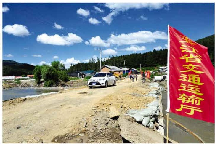
▲ 车辆和行人行走在刚刚搭设的友谊桥上