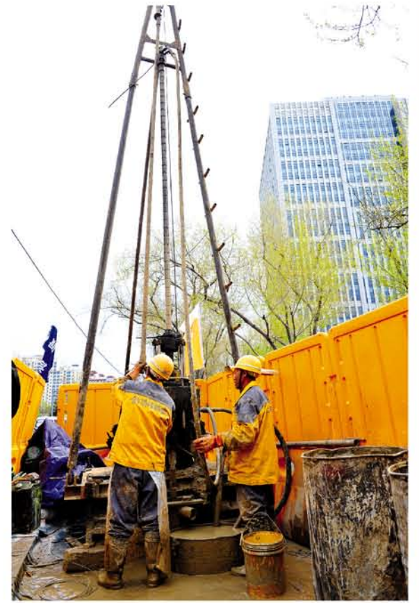
王颖 本报记者 姜久明 摄影报道

日前,记者来到哈尔滨市地铁四号线一期工程哈尔滨站前站勘察施工现场,临时搭建的黄色围挡内,四根铁管撑起的高架正承载着小型钻机轰鸣着,手上沾满泥巴的工人正在加紧进行钻探。