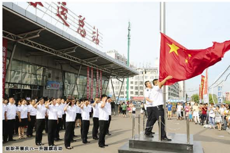
组织开展八一升旗活动

七台河市高速公路、干线公路、农村公路建设遍地开花,以高速公路为骨架,以国道干线公路为支撑,以农村公路为依托,以城市出口公路为纽带,四通八达公路网络体系基本形成,通车总里程已达1799.08公里,对地方经济发展产生持久而深远的影响。