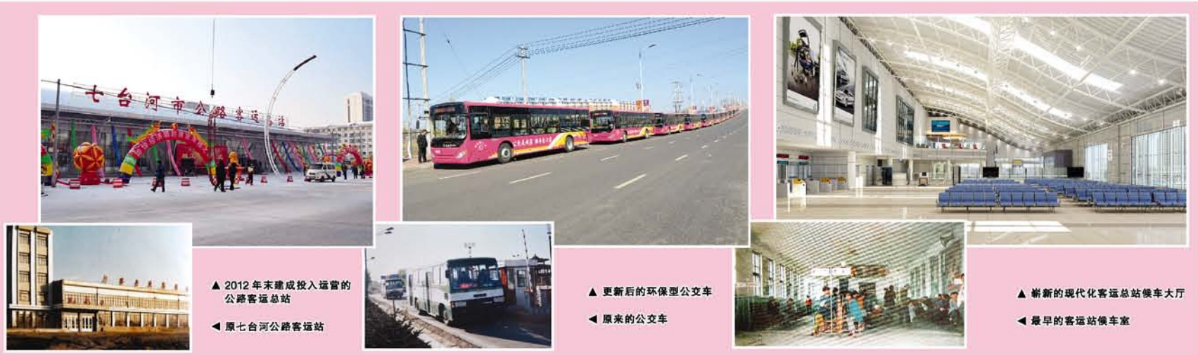
▲ 2012年末建成投入运营的公路客运站

自七台河市交通建设之初起,交通人一直秉承“不怕吃苦、敢于担当、甘于奉献、勇于创新”的七台河交通精神,用心做好每一件事,公路建设、连路成网,建设长途客运站,发展城市公交,提升服务水平……建设在路上,发展在路上,服务在路上,辉煌的交通事业,一直在前行!在交通人的不懈努力下,七台河市交通发展的明天会更加美好!