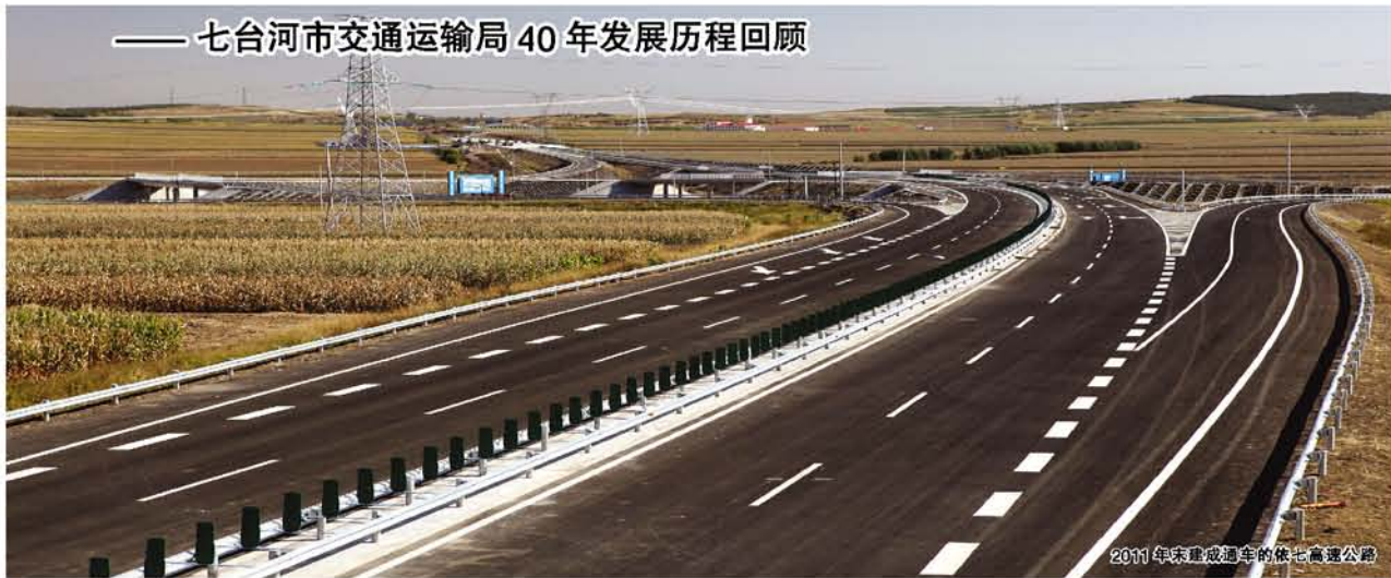
2011年末建成通车的依七高速公路

经济发展,交通先行。作为地方经济发展的先行官,七台河市交通运输局从1975年组建之日起,逢山开路,遇水架桥,为七台河经济发展夯实根基。尤其是进入“十一五”以来,交通人转变思想,创新举措,不断完善交通基础设施和路网建设,统筹城乡交通运输发展,让大交通建设成为了振兴七台河发展新引擎!交通人以前所未有的力度和速度演绎着“总把煤城换靓容”的故事;连成网的农村公路,使农村群众向往的“出门走上水泥路,抬腿坐上公交车”的生活成为现实;高速公路建成通车;国道实行高等级化改造;公路客运向“高速化”“直达式”方向发展……在几代交通人劈荆斩棘、攻坚克难的建设征途中,与七台河精神一脉相承的“不怕吃苦、敢于担当、甘于奉献、勇于创新”的七台河交通精神也逐渐形成。取得如此辉煌成就的交通事业,定然离不开交通人的无私奉献、辛勤劳动,在交通建设这条风雨路上,他们一直在前行,并将继续前行!