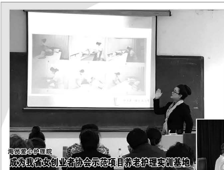
海员爱心护理院 成为我省女创业者协会示范项目养老护理实训基地

日前,由于定向培训高素质养老服务人才方面工作突出,省海员总医院爱心护理院被我省女创业者协会定为2016年中央财政支持社会组织参与社会服务项目——援助女性健康养老护理就业示范项目养老护理实训基地。 近年来,海员爱心护理院秉承服务失能老人,提升护理技能,奉献爱心,回馈社会的宗旨,勇于承担社会责任,积极与我省女创业者协会合作,通过系统理论教学与实践指导的方式,广泛开展了养老护理员教学培训、实践指导、协助对口就业工作,培养出一批拥有专业技能的高素质养老护理人员,有效地缓解了省内社会女性再就业压力。