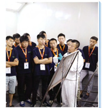
▲ 乐沃途快修连锁业务培训