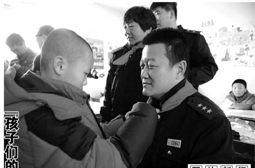
孩子们的愿望,我们来完成!

据了解,这个党支部以开展“两学一做”学习教育为契机,积极探索“三会一课”等制度以外的党员日常学习教育的方式方法,自今年3月组建党员微信、QQ学习群以来,利用微信、QQ交流平台定时发送党章、党规、党纪、党政时事信息、习近平总书记系列重要讲话,上级党委和行业主管部门有关党建党规党纪文件、会议精神等学习资料。此举,既为党员们提供了方便快捷的学习交流平台,又提高了党员学习的主动性和互动性,保证了党员学习的趣味性和系统性。