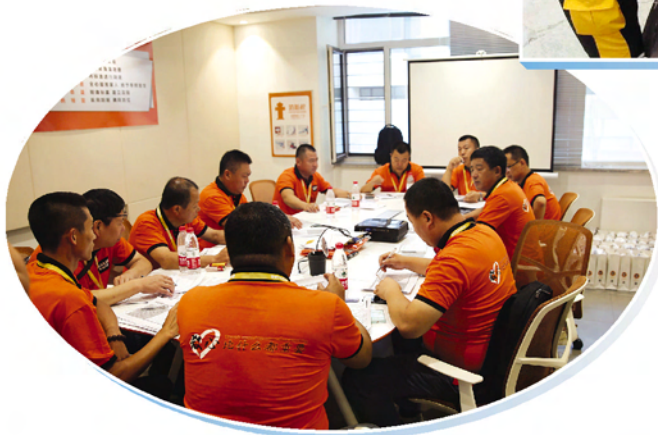
▲ 乐沃途快修连锁技术人员业务学习