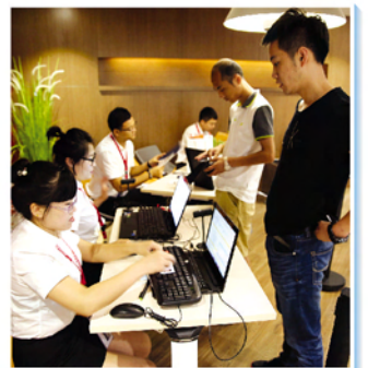
▲ 乐沃途快修连锁接待客户