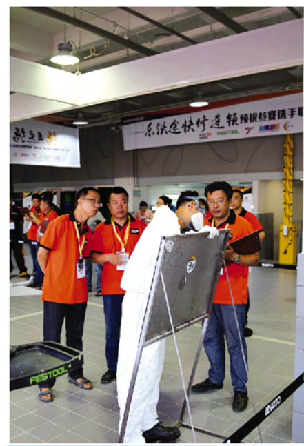
▲ 汽车快速修理技能大赛喷漆环节