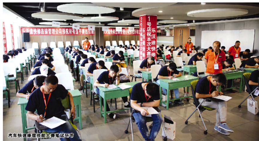
汽车快速修理技能大赛笔试环节