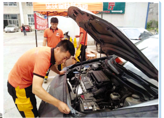
▲ 乐沃途快修连锁为小区居民免费检测车辆