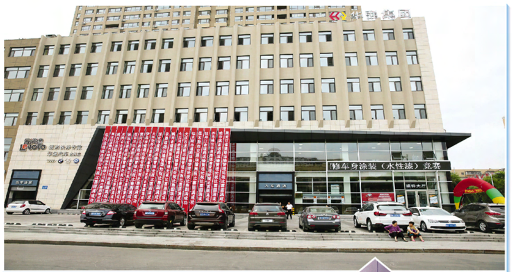
▲ 佳木斯乐沃途快修连锁总部