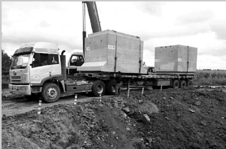
9月20日,宝明项目首道装配式箱涵安装完成。项目在箱涵施工过程中,积极推广应用“四新”技术,深入研究装配式箱涵施工工艺并总结与推广,取得很好效果。装配式就是将箱涵在预制厂分节集中预制,进行批量化生产,然后汽运至现场并拼装安装。预制装配式混凝土箱涵施工方法与现浇工艺相比具有整体性好、安全、环保等优点,加快了箱涵施工进度,缩短了建设周期,保证了箱涵质量,有效解决了目前公路建设中箱涵施工周期长、质量难以控制的问题。