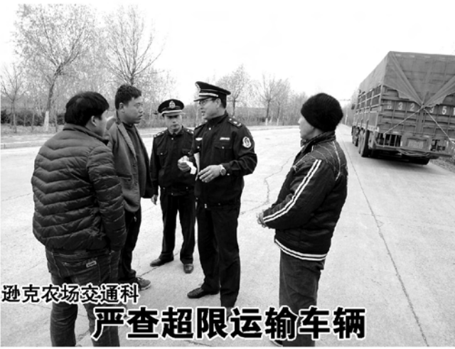
逊克农场交通科 严查超限运输车辆

行业诚信体系建设、清理和规范涉企收费等15项。方案明确了交通运输、工信委、公安局、工商局、质监局、各农场的职责分工,协调配合,形成合力抓好货车非法改装和超限超载治理。管理局还召开了专题会议,对各有关部门、各农场的具体工作做了安排部署,局领导要求各部门、各农场要把治理工作融入当前优化发展环境的大背景,合力营造安全畅通、规范有序的道路运输市场环境,统筹兼顾,正确处理执法与服务、服务与发展的关系。据悉,管理局还将组织督导检查,加强治理工作检查和考核,认真排查车辆改装、注册登记、市场准入、检验检测、货物装载、路面检测执法等全链条中各个环节的失职、渎职行为,依法追责。