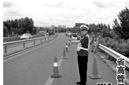
省高管局哈尔滨处