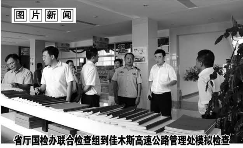
省厅国检办联合检查组到佳木斯高速公路管理处模拟检查

本报讯(王海萍 贾龙江)近日，笔者在八五七农场公路部门了解到，这个农场认真落实天津滨海新区重大火灾爆炸事故的沉痛教训，按照加强领导、强化监管、严密排查、坚持“党政同责、一岗双责”的原则，组织工作人员对辖区内所有等级公路安全状况进行了一次全面排查，全面加强安全管理，消除隐患保障路桥平安，确保安全生产工作万无一失。 这个农场公路部门对辖区各支线、干线134条公里公路的急弯、陡坡、桥梁、事故多发地段进行了重点排查，对公路保、小修养护施工各方面工作按照“全覆盖、零容忍、严执法、重实效”的总体要求，进行一次全面彻底排查，查出缺失交通安全禁令、警告标志等影响车辆通行的事故隐患做到立即整改，及时增设、补齐各类警示、警告标志牌13块，消除了隐患。同时，健全完善各项应急预案并进行安全演练，健全完善从业人员安全生产培训档案，重点排查特种作业人员特种作业上岗证件是否齐全有效，与有关人员层层签订公路安全包保责任状，落实安全责任制。机务科对所有作业车辆进行一次安全检查，保证性能完好，加强机驾人员安全教育，坚决做到车辆不保养不出车、人员安全防护不到位不作业、形成了有效预防、从源头消除安全隐患，确保职工群众出行安全。